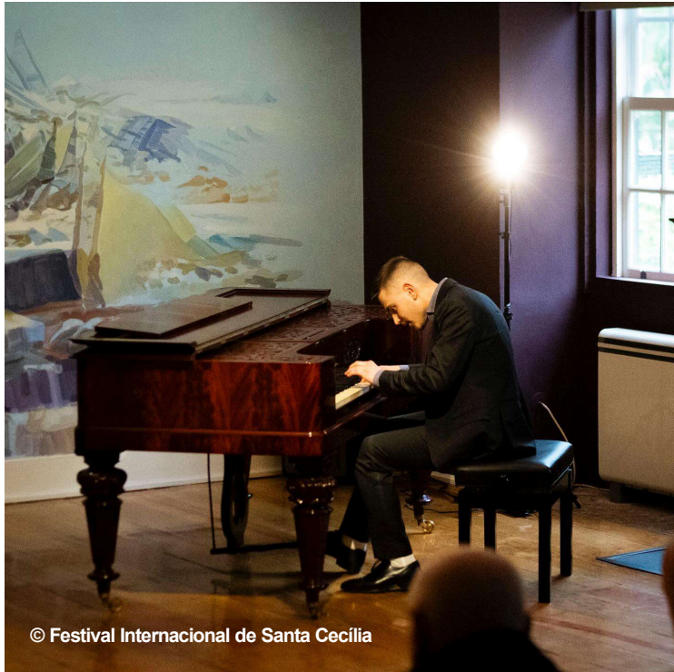
© Festival Internacional de Santa Cecília

Texto elaborado pelo professor Luís Costa